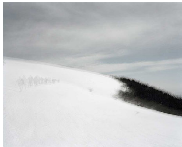
LURE – Mars 2009