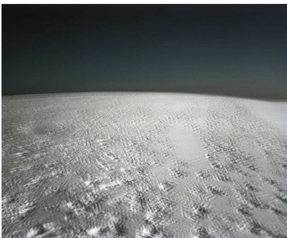
LURE – Février 2009

« Avec obstination, je parcours les paysages naturels pour capter les possibilités plastiques de la puissance tellurique qui s'en dégage. Cet idéal guide ma photographie. Mon immersion dans la nature vive forge le cadre de mes prises de vue. Le résultat de mon implication physique à l'élément imprime mes images qui se veulent dès lors comme des sculptures mentales. » Eric BOURRET