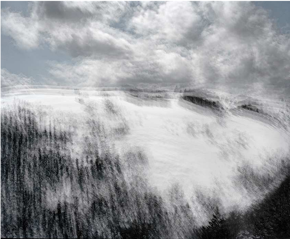
LURE – Avril 2009