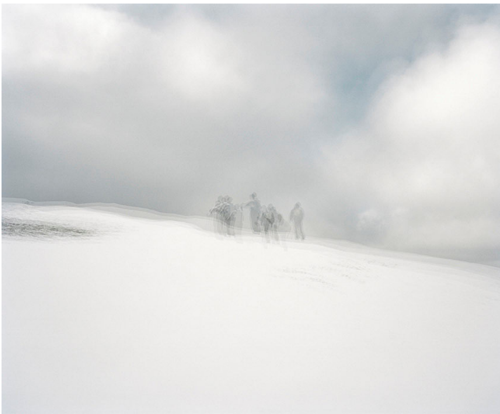
LURE – Février 2010